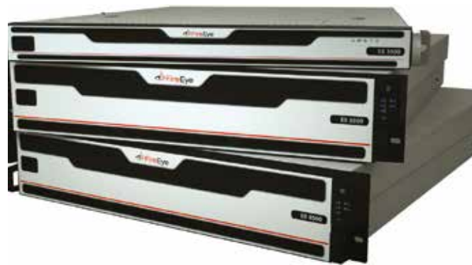
Abbildung 1: Integrierte Appliances für Email Security: EX 3500, EX 5500 und EX 8500